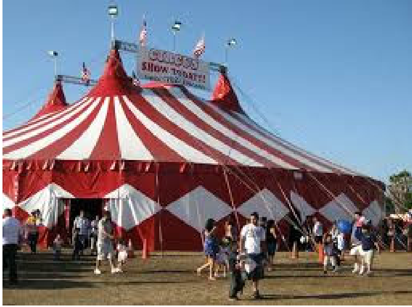
April 30, 2021, Circus Comes to Town, Toronto