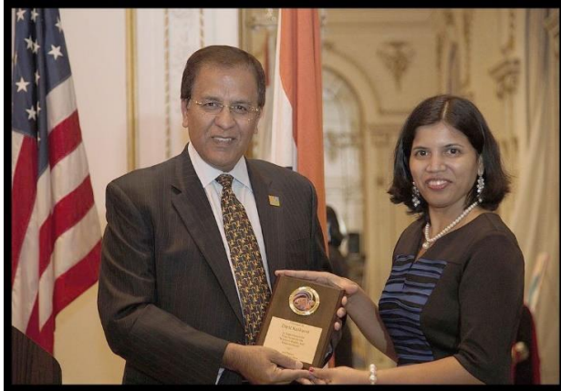
इंडस अमेरिकन बँक तर्फे "अॅप्रिसिएशन अॅवॉर्ड"

"Women's Rights and Empowerment" सीरीज काढतानाचा माझा प्रवास स्वतःसाठी एक फार वेगळा अनुभव होता. प्रत्येक चित्र पूर्ण झाल्यावर "Sense of Satisfaction" पेक्षा "Sense of Realization" ची भावना जास्त होती.