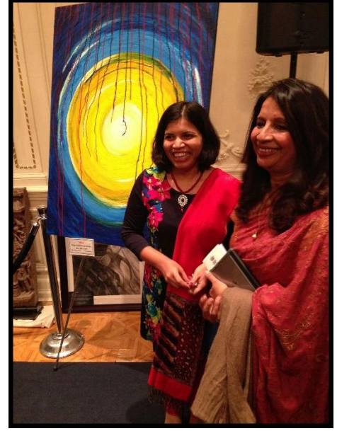
भारताच्या पूर्व-राजदूत सौ. निरूपमा राओ यांची प्रदर्शनास भेट