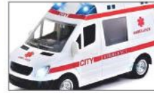
Free Ambulance Services